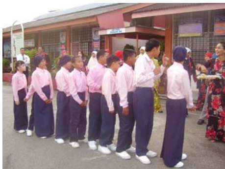
Pengawas beratur sebelum menerima tali leher daripada guru besar.