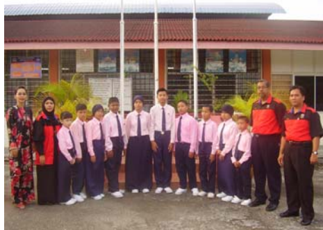
Barisan Pengawas bergambar bersama pentadbir sekolah selepas majlis pertantikan.

dijalankan serentak pada hari Isnin 7 Januari 2008 beserta perhimpunan mingguan.