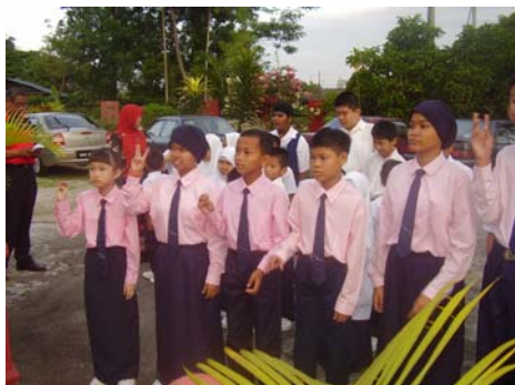
Bacaan ikrar oleh para pengawas.