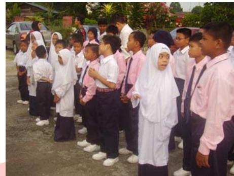
Sebahagian daripada murid SKKP BP