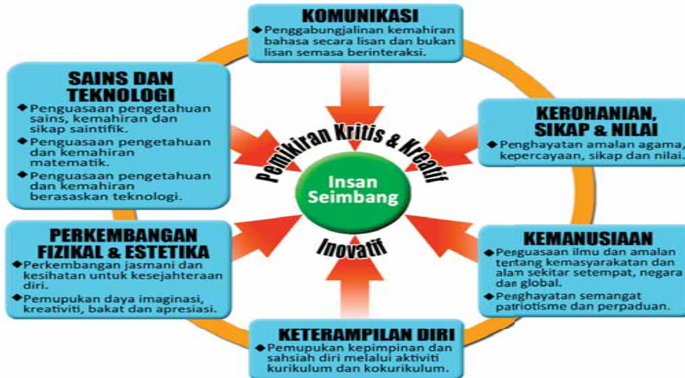
Bentuk Kurikulum Transformasi